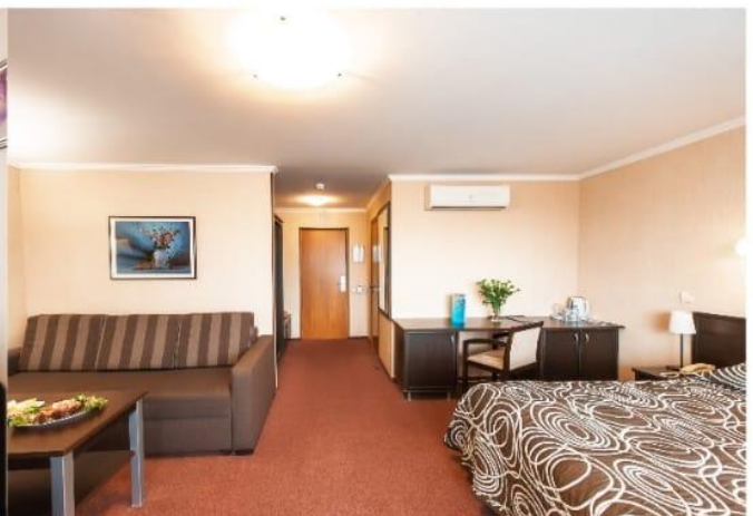
Студия 1комн. 2местн