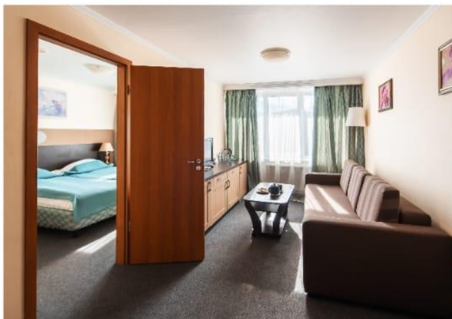
Бизнес 2комнатый 2местн