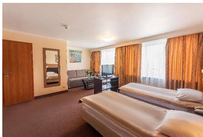
3-местный номер (28 кв.м.)