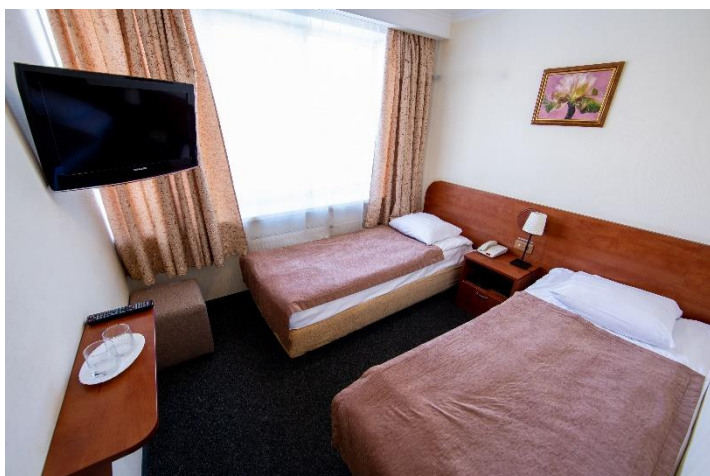
2-местный номер (16 кв.м.)

На нашем завтраке, проходящем ежедневно с 07.00 до 11.00 представлен широкий ассортимент блюд: каша, запеканка, омлет, сырная и мясная нарезки, гарниры на выбор, куриные котлеты, сосиски и овощи, маслины, оливки, кукуруза, соленья, салат, сухие завтраки, молочная продукция, творожная масса, хлеб, булочки, тосты, свежая выпечка, печенье, вафли, фрукты, различные соусы и джемы, чай, кофе, морс.